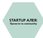
STARTUP АЛЕЯ: Проекти та community