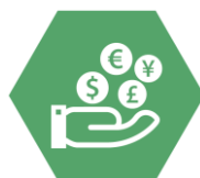
Фінанси та інт. власність